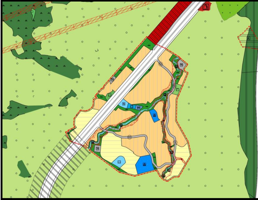
Şekil 4: 1/5000 Ölçekli Plan Değişikliği Örneği

Değişen Arazi Kullanım değerleri Tablo 1’de gösterilmiştir.