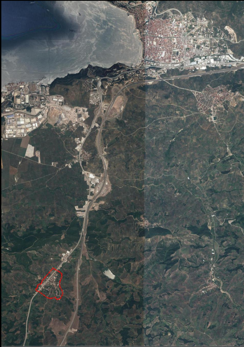
Şekil 1: Plan Değişikliğine Konu Alanın Konumu

Plan değişikliğine konu Kurtul Mahallesi, Bursa İli, Gemlik İlçesinin mahallelerinden birisidir. Kurtul Mahallesi, Bursa İl Merkezine 22 km, Gemlik İlçe Merkezine 10 km uzaklıktadır. Bursa-Yalova Yolunun doğusunda konumlanmış olup, alanından doğusundan Bursa-İzmir Otoyolu geçmektedir.